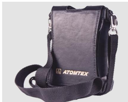
Чехол для хранения и ношения прибора